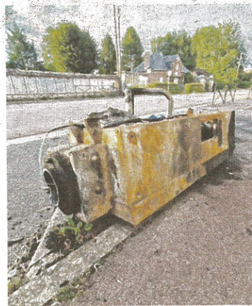
Voilà une semaine que la carcasse est sur le trottoir